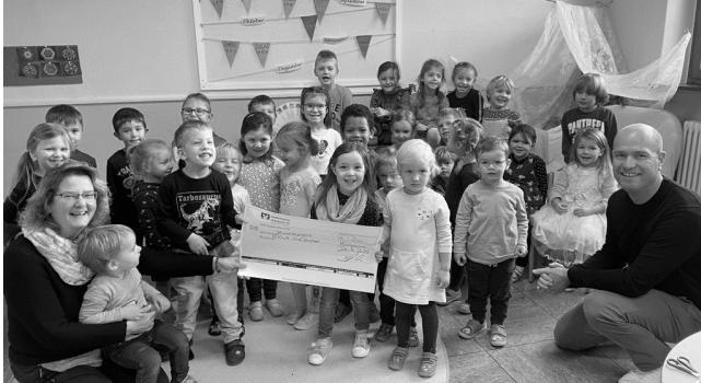
Ihr Team vom Kath. Kindergarten St. Peter und Paul

Wir freuen uns sehr, dass wir auch dieses Jahr wieder eine Spende von der Heidenheimer Volksbank bekommen haben. Gemeinsam mit den Kindern überlegen wir nun was wir von den 200 € anschaffen wollen. Dankeschön!!