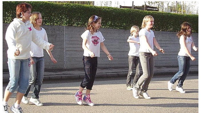
und in Kleinkuchen

Mit Musik, Gesang und sportlichen Darbietungen wird der 1. Mai begrüßt. Oftmals nach einem langen Winter, freuen sich Jung und Alt gemeinsam auf die schöne wärmere Jahreszeit.