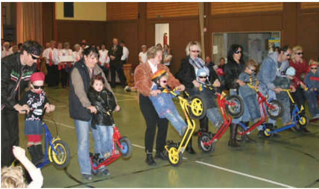
Maifeiern 2008 in Großkuchen

Zu einem Schmuckstück in unserer Ortschaft ist der Osterbrunnen geworden. Liebevoll gestaltet von den Frauen des Obst- und Gartenbauvereins sowie der Mithilfe der Grundschule Großkuchen.