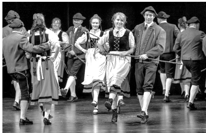
Heidenheimer Schäfertanzgruppe im Jahr 2018,

und Schäfermusikanten, die Folkloregruppe TradiSon aus Galizien, die Harzer Birkenblattbläser und das Tanzjugend-Ensemble Frommern mit der Musikgruppe Wacholderklang versprechen eine abwechslungsreiche Unterhaltung, die begeistert. Konzerthaus Heidenheim, 15 €/12 € ermäßigt (Mitglieder des SAV, Behinderte, Schüler, Studenten mit Ausweis), freie Platzwahl, VVK Stadt-Information Heidenheim, Tel. 07321 327-4910 oder Abendkasse.